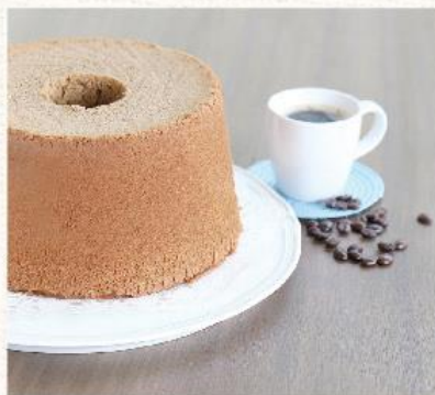
莊園咖啡 Coffee NT. 480

產自日本靜岡的抹茶綠粉，為戚風本體添上春意盎然的氣息。獨特的溫潤甘甜，每一口都繚繞著淡雅微蜜，好像聖經上說“才德的婦人”那般令人舒適愉悅而動人。