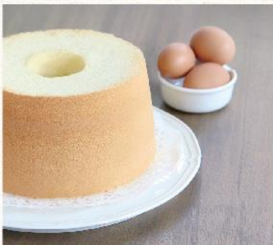
蒹藏蛋香 Vanilla Flavored NT. 480

創造如棉絮、如初生、集綿軟Q彈於一身，真正好吃的戚風蛋糕。 溫熱食，濕潤嫩軟香味四溢；冷藏食，幼綿濕潤又Q彈。