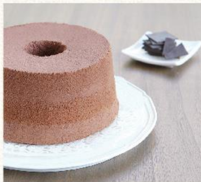
魅力巧克 Chocolate NT. 480

以檸檬飽滿多汁果肉與青綠外皮的天然精油為基底，純粹乾淨的天然微酸味，像極了身邊好夥伴們形狀不同的熱情，清爽有勁地在心上微微發酵著酸甜交融的芬芳香氣。