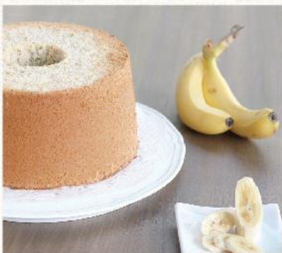
如蜜蕉甜 Banana NT. 480

錫蘭，印度洋上的一顆珍珠，一個可以沒有化妝品但不能沒有微笑的國度。微笑的紅茶，恰如鄰居和氣溫暖的“燒就問”。嚐嚐！你也會不自覺地微笑起來。