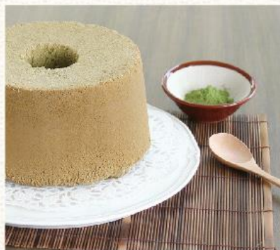
初春抹綠 Green Tea NT. 480

台灣香蕉自然稠密的質地使蛋糕本體特別的潤澤豐盈，獨特細緻的口感與自然鮮甜共築口中迷人的感受；彷彿默默護家的父親，祕而不宣的慈愛，耐人回味。