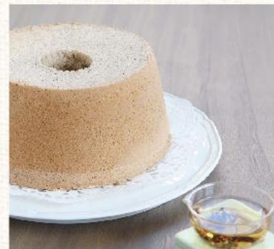
深紅錫蘭 Ceylon Tea NT. 480

親手調溫百純黑巧克力，拌混鮮奶油，細心計量不膩的甜。瑰麗的深咖啡色外觀，仔細藏著輕甜，彷彿眼中只見彼此的甜蜜愛侶，散放似有若無的香氣緩緩而來。