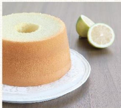
清新萊姆 Lemon NT. 480

剛出爐時，烘熱的蛋香一如純稚的孩子，真誠討喜；細細看去，香草豆莢迸出的粒粒籽兒，點綴成口中散放的馨香氣息，恰似生命的成熟，總有耐人尋味的驚喜。